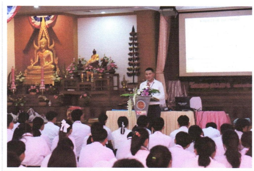
นักเรียน นักศึกษา วิทยาลัยเทคนิคนครโคราช เข้าร่วมกิจกรรมโครงการเข้าค่ายคุณธรรม จริยธรรม