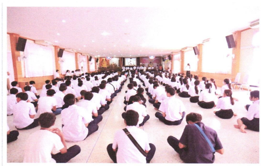
นักเรียน นักศึกษา วิทยาลัยเทคนิคนครโคราช เข้าร่วมกิจกรรมโครงการเข้าค่ายคุณธรรม จริยธรรม