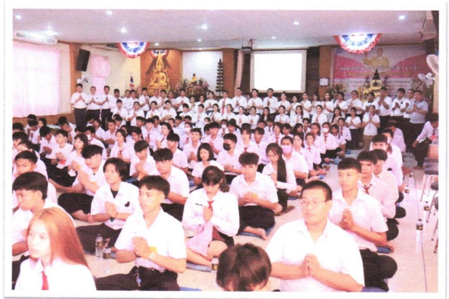
นักเรียน นักศึกษา วิทยาลัยเทคนิคนครโคราช เข้าร่วมกิจกรรมโครงการเข้าค่ายคุณธรรม จริยธรรม