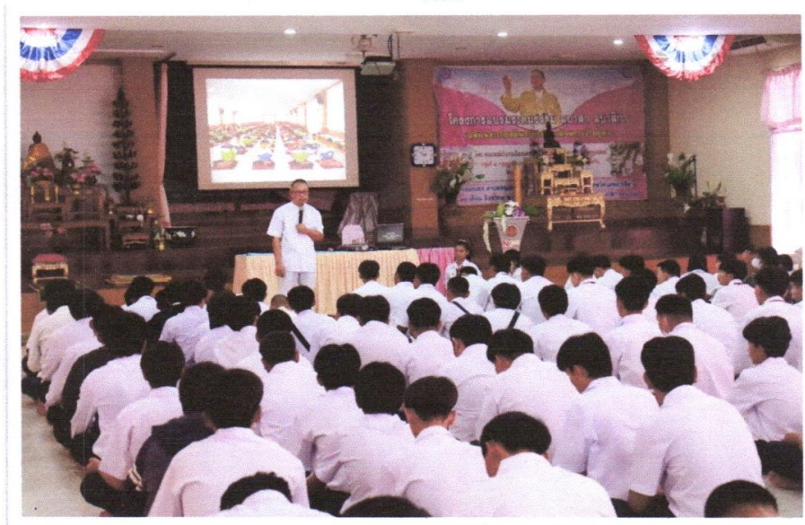
นักเรียน นักศึกษา วิทยาลัยเทคนิคนครโคราช เข้าร่วมกิจกรรมโครงการเข้าค่ายคุณธรรม จริยธรรม