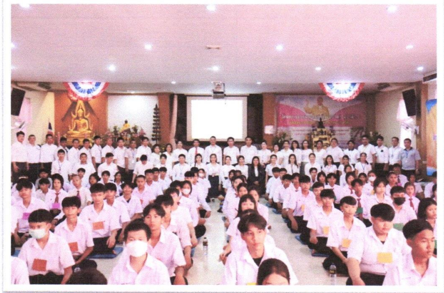
นักเรียน นักศึกษา วิทยาลัยเทคนิคนครโคราช เข้าร่วมกิจกรรมโครงการเข้าค่ายคุณธรรม จริยธรรม