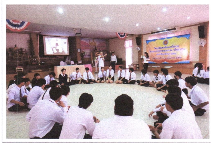
นักเรียน นักศึกษา วิทยาลัยเทคนิคนครโคราช เข้าร่วมกิจกรรมโครงการเข้าค่ายคุณธรรม จริยธรรม